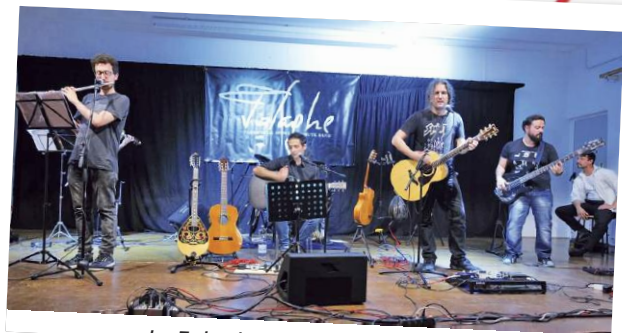
Le Folaghe, tributo a De André

Febbraio ci ha visti protagonisti insieme ai bambini mascherati per il carnevale: "Il magico mondo di Laura" con le sigle dei cartoni animati; a marzo sono saliti sul palco i "No Way" con le musiche degli anni 60/80.