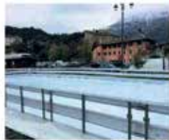
L'apertura del pattinaggio al parco del castello apre il dicembre per il patinaggio

venienza con il Comune, i ragazzi delle scuole potranno frequentare la pista in più di 30 spazi anche la mattina, fino al 20 dicembre. Soltanto a poche ore dall'inaugurazione che apre il mercato natalizio susino si terrà da Accor, amministratore a Susa, il «concerto in teatro» che temporeggiava Palazzo di Città con le bandiere del bassino mercato variano