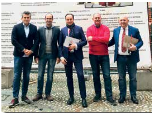
Il Presidente della Regione Piemonte Cirio incontra l'amministrazione di Susa