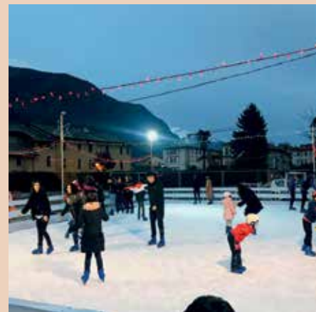
Per le feste di fine anno, la città sta organizzando e proponendo varie iniziative per fare festa

vive con maggiore piacere ed è una Città che va incontro alle esigenze dei propri cittadini prima ancora dei propri villeggianti o visitatori. Una Città con molti eventi ottiene maggiore interesse e partecipazione dei residenti ed ottiene un rafforzamento di tradizioni e valori locali e nel frattempo ottiene un aumento della notorietà dell'area come destinazione turistica. L'intento deve essere quello di ottenere una crescita delle potenzialità delle attività commerciali di Susa. Gli sforzi maggiori saranno dunque sempre più in direzione della comunicazione e promozione di tutto che ciò che accade in Città.