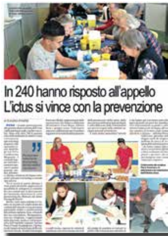
In 240 hanno risposto all'appello L'ictus si vince con la prevenzione

"Siamo molto soddisfatti dell'esito della giornata che ha rappresentato inoltre una occasione per far comprendere agli studenti dei diversi ordini di scuole intervenuti l'importanza della prevenzione e dei corretti stili di vita per mantenere fin da giovani una buona salute; erano infatti presenti nell'ambito dei progetti di alternanza scuola lavoro, gli studenti dell'Istituto Ferrari di Bussoleno e del Liceo Norberto Rosa di Susa e Bussoleno, gli studenti del Corso di Laurea in Infermieristica e Dietistica, seguiti dagli infermieri e dagli altri operatori dell'ASL presenti nella mattinata.