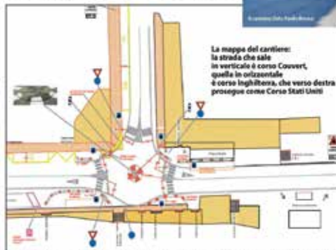
La mappa del cantiere: la strada che sale in verticale è corso Couvert, quella in orizzontale è corso Inghilterra, che verso destra prosegue come Corso Stati Uniti

SUSA. Un nuovo grande cantiere si apre all'incrocio tra corso Inghilterra (SS25) e corso Luciano Couvert, all'angolo tra la stazione ferroviaria e l'ospedale. Infatti, sono stati avvisati dalla Città Municipale i lavori per la realizzazione di una rotonda sperimentale, che avrà la funzione di fluidificare il traffico, ridurre la velocità delle automobili in prossimità della stessa e, di conseguenza, rendere più sicuro il transito dei veicoli in strada e gli attraversamenti pedonali. Il progetto di cantiere, che prevede anche la realizzazione di alcuni metri di marcia, come i pedicelli e le barriere che dovranno essere installati nella zona. Secondo l'ordinanza n. 55 del 28 ottobre del Comune, Polizia Municipale, in base alle necessità del traffico, si è deciso di realizzare la rotonda sperimentale in un'area di 100 metri di diametro, con un'area di 3000 metri quadrati. Il cantiere sarà aperto per un periodo di 120 giorni, a partire dal 15 novembre. Durante il periodo di cantiere, il traffico sarà deviato in modo da garantire la sicurezza dei pedoni e dei ciclisti. Il cantiere sarà aperto in modo da garantire la sicurezza dei pedoni e dei ciclisti.