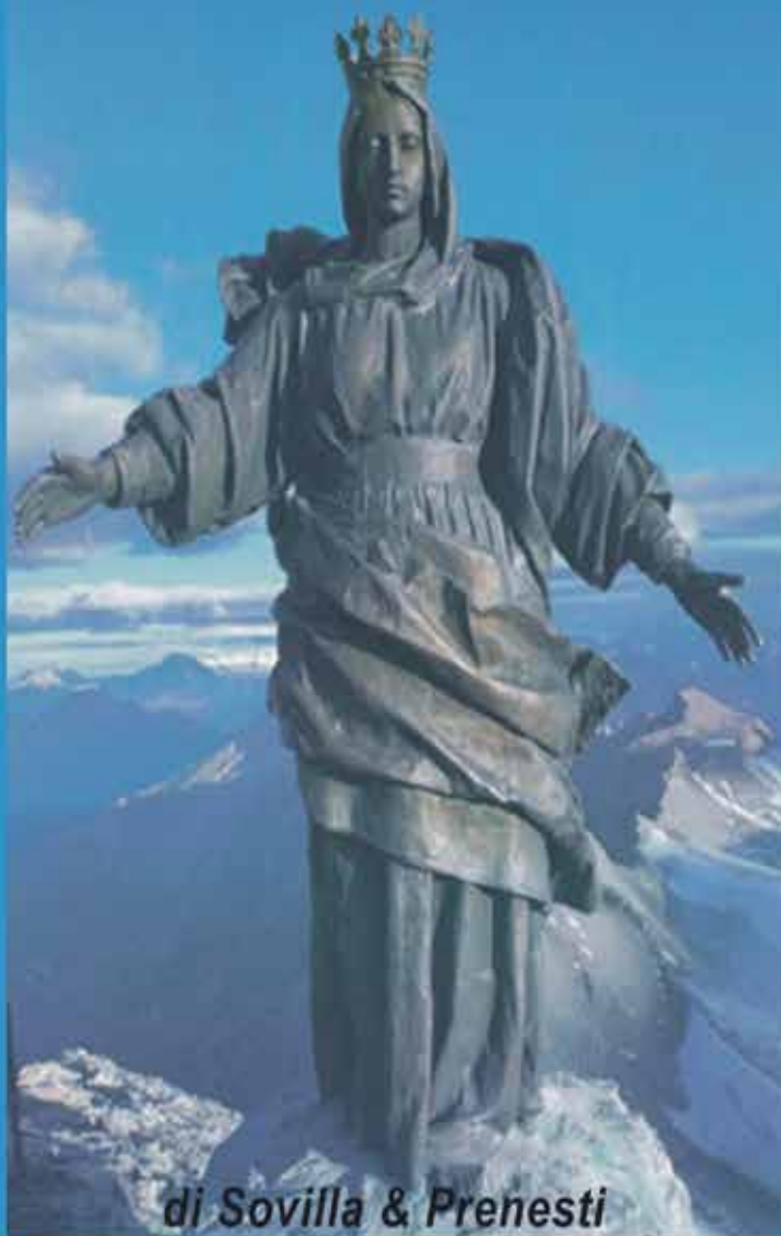
di Sovilla & Prenesti