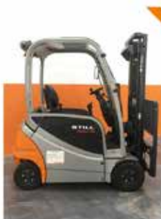
Frontale elettrico 4 ruote 20 q.li a partire da 16.950 €