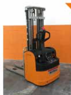
Stoccatore a Timone a partire da 4.200 €