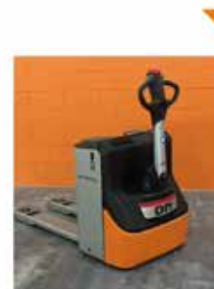
Transpallet elettrico a partire da 2.400 €