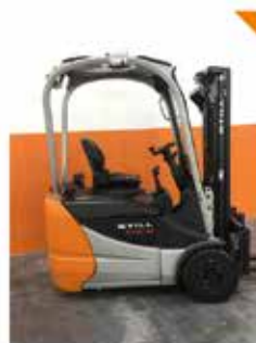
Frontale elettrico 3 ruote 15 q.li a partire da 7.900 €